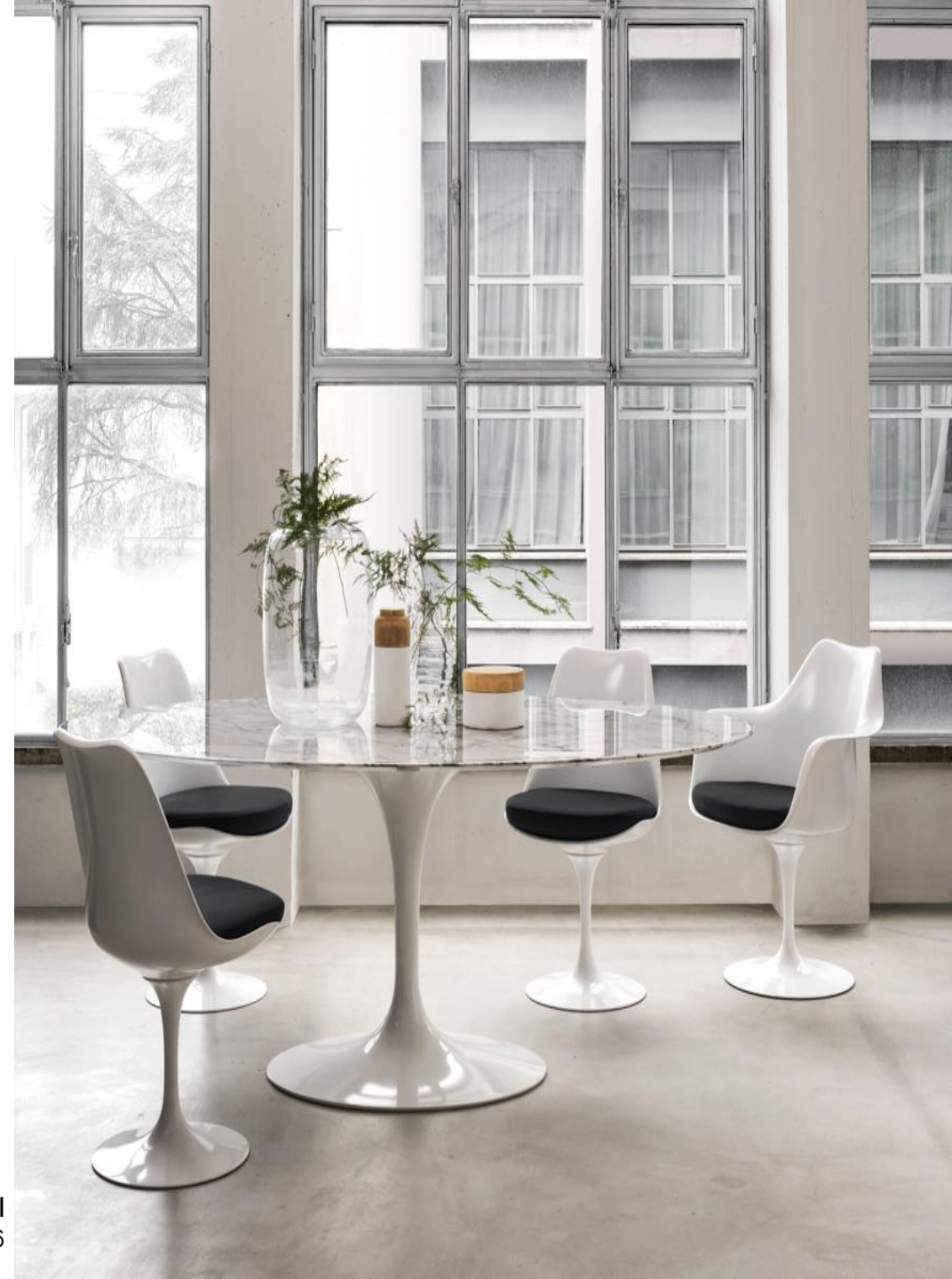
Tulip, Knoll Eero Saarinen, 1956