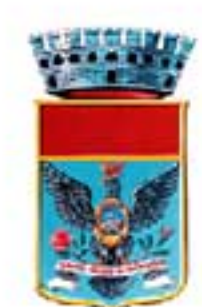
Comune di Rosolini