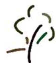
Ordine dei Dottori Agronomi e dei Dottori Forestali della Provincia di Siracusa