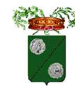
Provincia Regionale di Siracusa