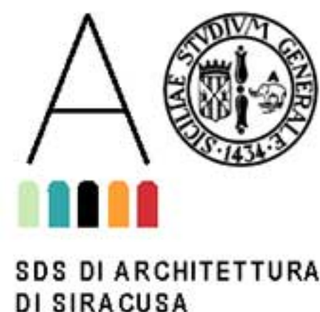
SDS DI ARCHITETTURA DI SIRACUSA